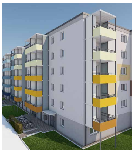
Visualisierung der Merkurstraße 1–15

Im Jahr 2025 laufen die Arbeiten zur Fassadensanierung und der Erneuerung der Balkone an den Gebäuden Sonnenallee 6 und Merkurstr. 1–15 bereits auf Hochtouren. Die energetische Sanierung der Fassaden und die Modernisierung der Balkonanlagen verbessern den Wohnkomfort und tragen zur Senkung der Heizkosten bei.