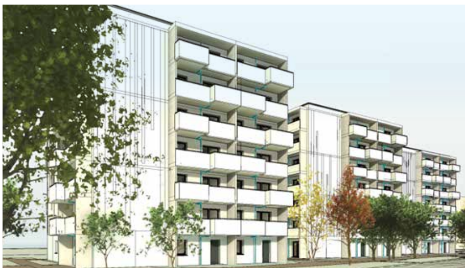
Perspektive Sonnenallee 2, 4, 6

Mit diesen Maßnahmen setzen wir auf nachhaltige, langlebige Materialien und steigern die Attraktivität unserer Wohnanlagen. Wir freuen uns darauf, gemeinsam ein noch schöneres Zuhause für unsere Mieter zu schaffen.