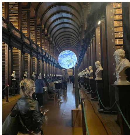
Bibliothek Trinity College

Ich hatte 4 wunderschöne Wochen in Irland, die mir einige Erfahrungen und Eindrücke geschenkt haben. Alles in Allem bin ich stolz, an diesem Praktikum teilgenommen zu haben und bin dankbar für die mir gebotene Möglichkeit.