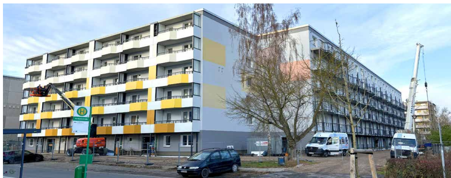
Fertiggestellte Balkone in der Herkulesstr. 2–6 und Montage der neuen Balkone in der Sonnenallee 14–24

Die Bewohner der Herkulesstr. 2–6 haben allen Grund zur Freude. Noch vor der Adventszeit wurden die neuen Balkone zur Nutzung freigegeben.