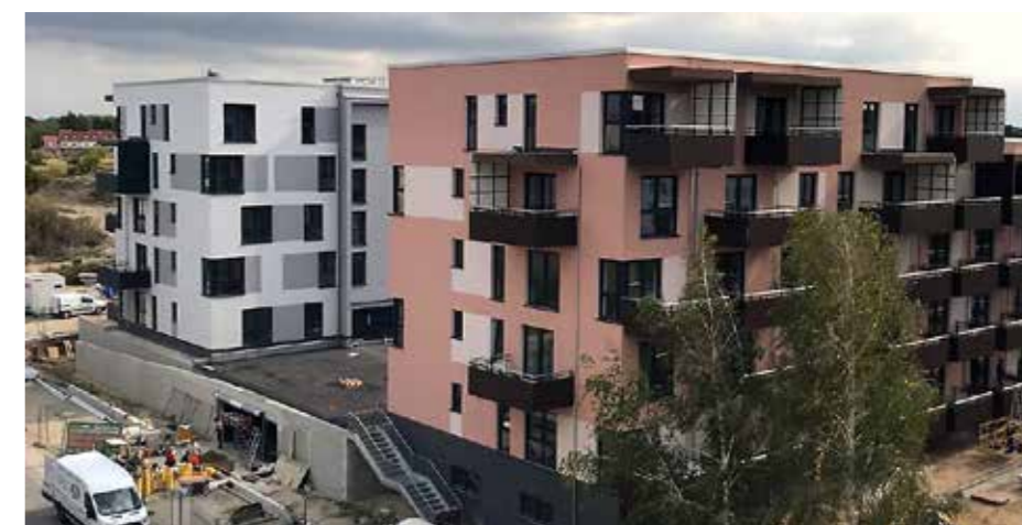
Neubau Herkulesstraße 13-19 (Wiesengrund)

Hermann-Duncker Straße 2-12. Bedauerlicherweise mussten wir den Einbau von Aufzügen wegen fehlender Kapazitäten am Markt für die Sonnenallee 2, 4, 6 auf Anfang nächsten Jahres verschieben. Aber die Mieter der Herkulesstraße 4, 6, 8 und 14 sowie der Merkurstraße 3, 11 und 13 können sich freuen, sie erfahren nun durch den Einbau von Aufzügen mehr Wohnqualität. Sie als Mieter haben aber sicherlich im Laufe des Jahres die vielen kleinen Baumaßnahmen im Bestand registriert. Auch dieses Jahr wurden in vielen unserer Häuser nach und nach die Kellerverschläge sowie Wohnungsinnentüren erneuert und Treppenhäuser saniert. Die Fassaden vieler Häuser wurden farblich aufgefrischt. Wir