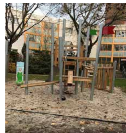
Burgähnlicher Spielplatz „Am Henkerhaus“ (Mühlenstraße)

In 2020 wurde natürlich auch viel instandgesetzt und erneuert, so auch z. B. die Fassade und die Balkone in der