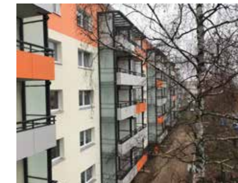
Fassadenanstrich und Balkonneubau in der Hermann-Duncker-Str. 2-12

freuen uns sehr über diese Fortschritte in unseren Bestandshäusern. Mit all diesen Maßnahmen runden wir das gute Bild unserer Objekte ab und schaffen einen Mehrwert für unsere Heimatstadt Bernau.