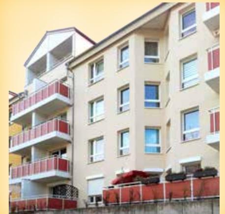
Am Mahlbusen 71-75

Auch in diesem Jahr werden wieder diverse Fassaden modernisiert und gereinigt und so das Bernauer Stadtbild verschönert.